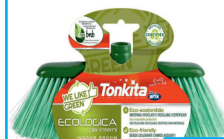
Tonkita COD 95313

DETERGENTE ALCOLICO PER SUPERFICI E TESSUTI SANIALC ULTRA - 750 ML