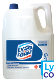
Lysoform COD 89427

DISINFETTANTE DETERGENTE LYSOFORM - 1100 ML