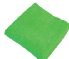
Love Clean MPSPANNOMICROFIBRA