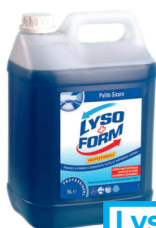
Lysoform COD 70892

DETERGENTE DISINFETTANTE PER PAVIMENTI 5 LT